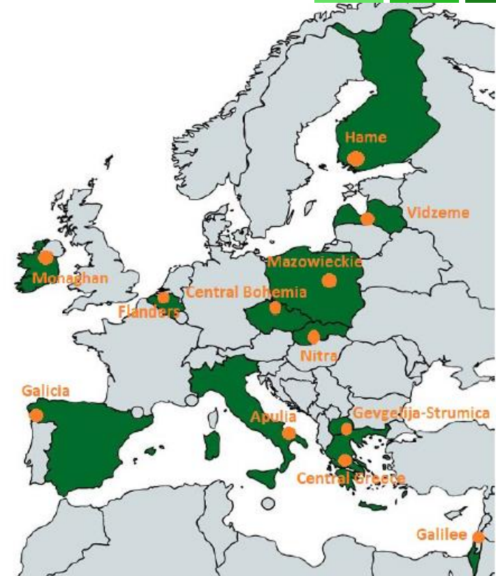
Figure 24. PoliRural study areas