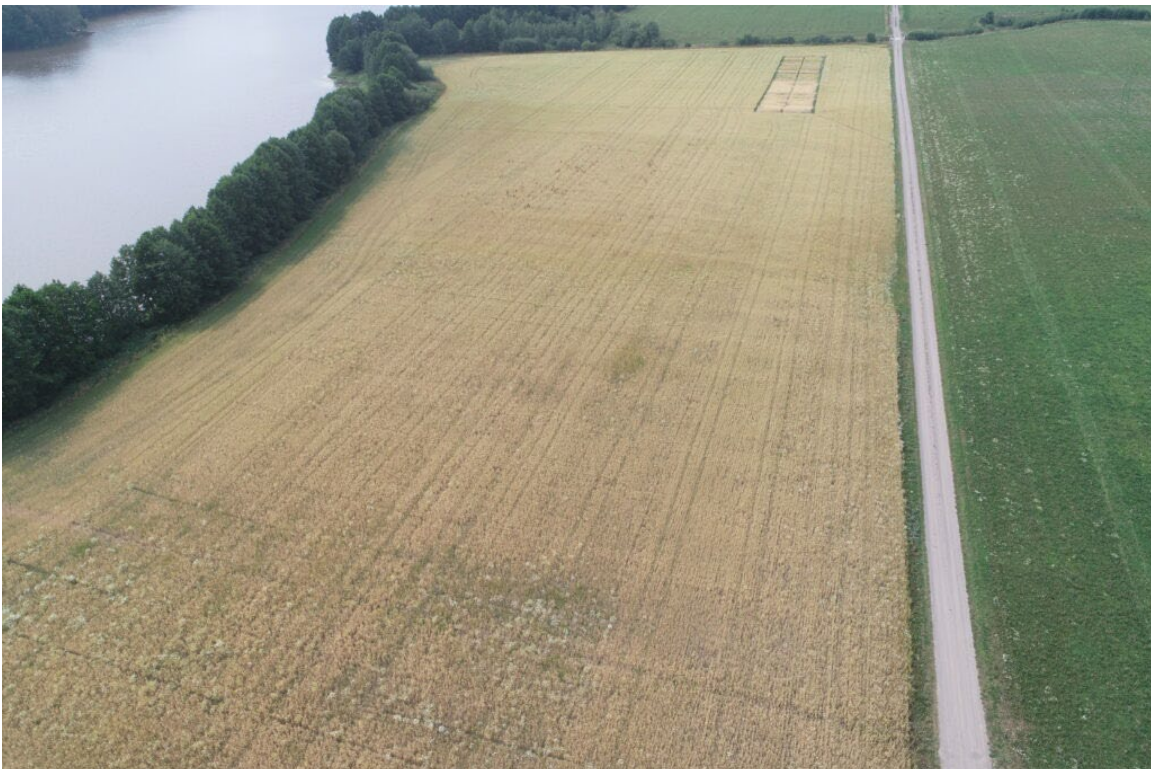
Kuva 5: Droonikuva 15.7.2021.

Kuvassa 5 lohko kuvattuna droonilla 15.7.2021. Satovuonna saunakukkaa oli paikoin alueella runsaasti, kuva 6. Kuidulla ei tuntunut olevan vaikutusta saunakukan esiintymiseen.