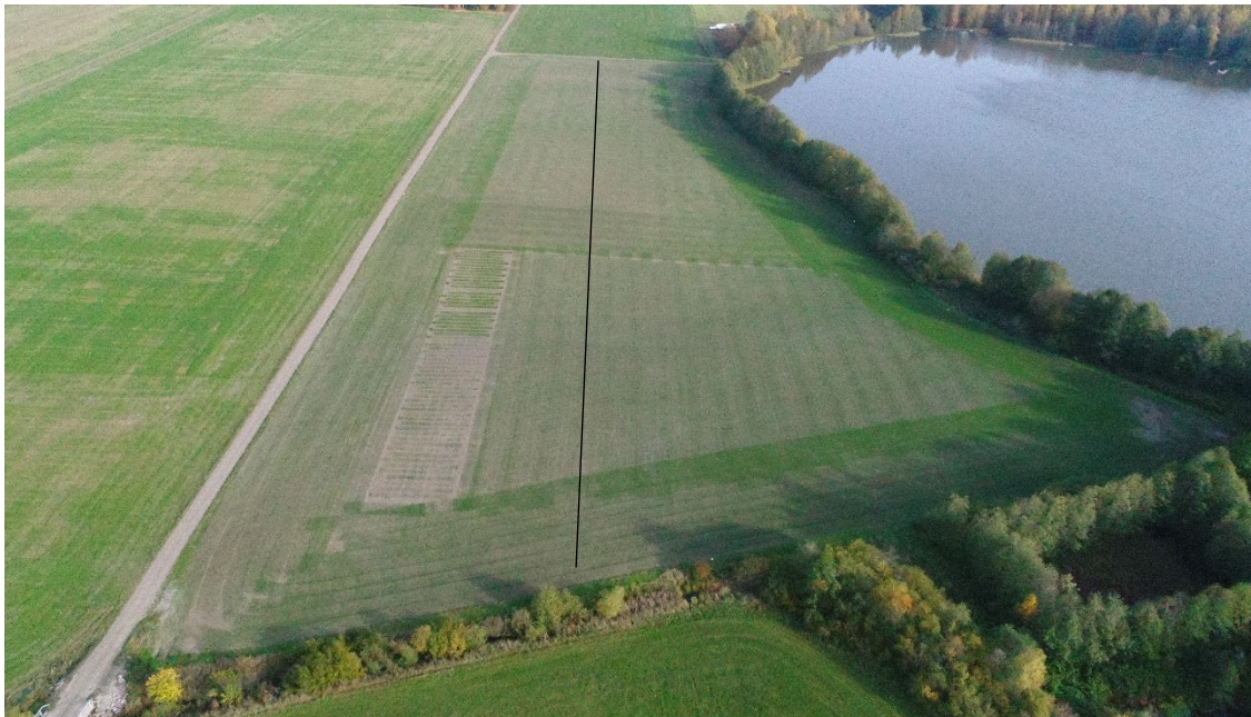
Kuva 3: Droonikuva 2.10.2020

Kuvassa 3 syysvehnäkasvusto oraalle tulon jälkeen. Kuvaus tehty länsisuunnalta 2.10.2020. Kuidun levitysalue on mustan viivan oikealla puolella. Kuidun levitys ei näkynyt oraskasvustossa syksyllä. Kynnetyn ja lautasmuokatun raja näkyy keskellä lohkoa poikittaisena tumman ja vaaleamman alueen rajana.