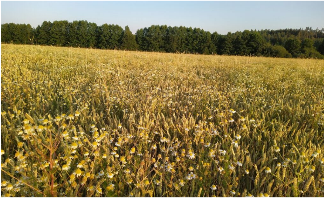
Kuva 6. Syysvehnäkasvustoa ennen puintia.

Kuvassa 7 on syysvehnän satokartta syksyllä 2021. Lohkon vasemmassa yläosassa oleva valkoinen raita on koeruutualue. Valkoisen alueen jatkeena oikealla on alue, mihin ei levitetty lietettä. Kuidun levityksellä ei näyttänyt olevan vaikutusta syysvehnän satotasoon.