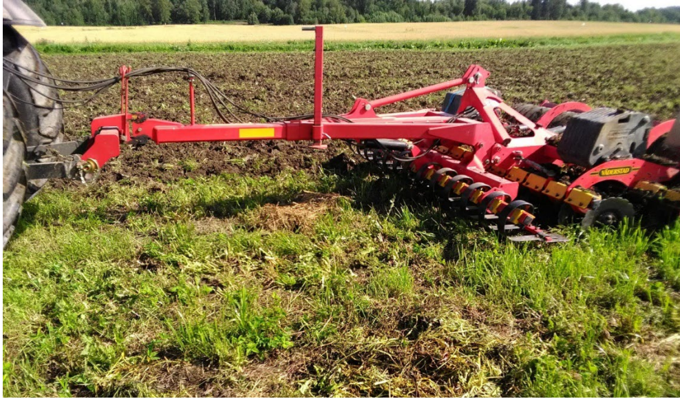
Kuva 2: Lautasmuokkaus syksyllä 2020.