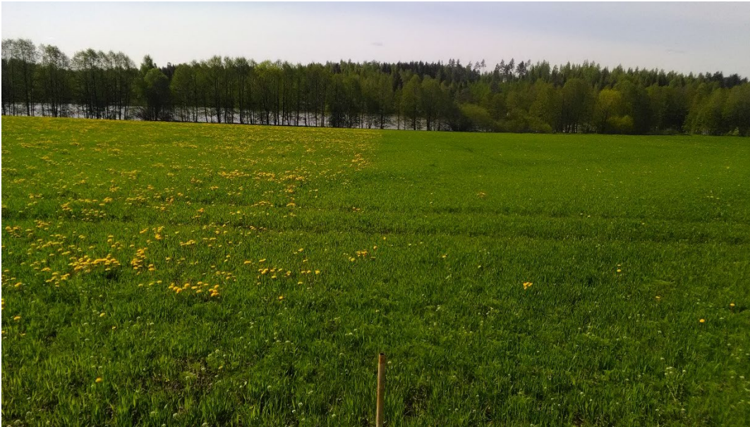
Kuva 4. Eri käsittelyjen raja, Oikealla kynnetty ja vasemmalla lautasmuokattu alue.

Kuvan 4 keskellä on lautasmuokatun ja kynnetyn raja kuvattuna 25.5.2021. Kynnetyllä alueella, tolpan oikealla puolella on huomattavasti vähemmän voikukkaa.