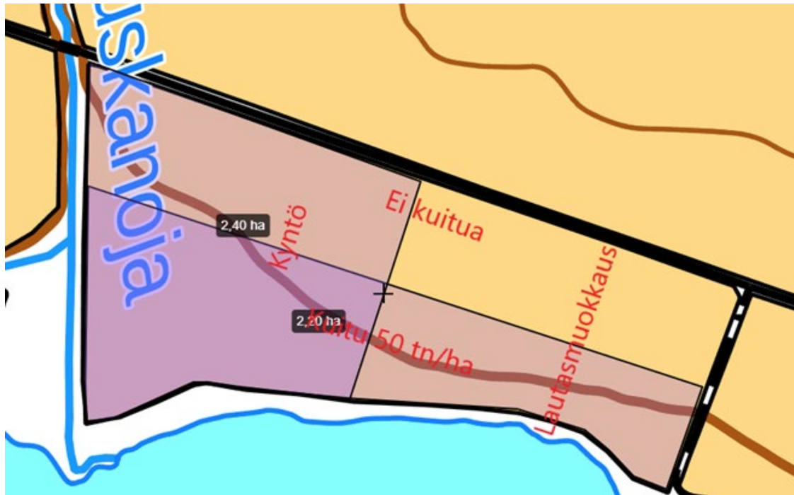
Kuva 1: Eri käsittelyt kartalla.

Kuvasta 1 ilmenee kuidun levitysalue (lohkon alaosa), joka tehtiin syksyllä 2020 sekä kynnetyt ja lautasmuokatut alueet syksyllä 2020. Lautamuokkaus tehtiin kuvan 2 muokkaimella.